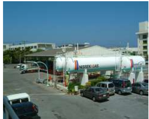
浦添物流センター LPガス充填所

【業務内容】LPガスおよびLNG(液化天然ガス)の販売／容器並びに 燃焼機器等の販売／空調機器(GHP)の販売