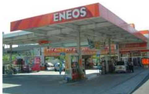
車検工場・ディテリング工場併設SS 与那覇店