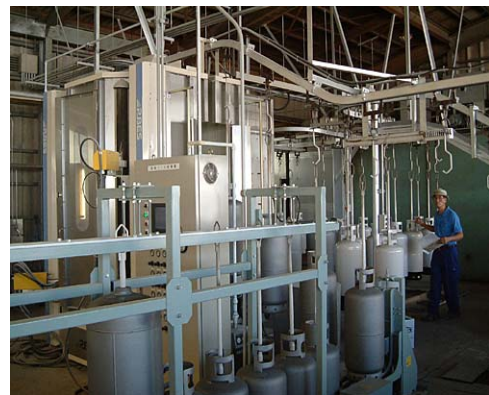
LPガス容器耐圧検査場