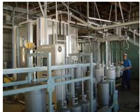
LPガス容器耐圧検査場