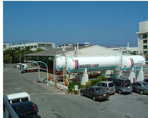
浦添物流センター LPガス充填所

【業務内容】LPガスおよびLNG（液化天然ガス）の販売／容器並びに燃焼機器等の販売／空調機器（GHP）の販売