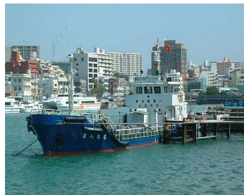
バージ給油船 第八旭丸

【業務内容】石油及び潤滑油の直売／エネルギー商品(分散型電源等)の販売／空調機器(KHP)の販売