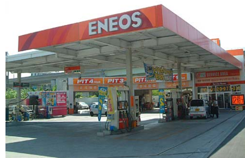
車検工場・ディテリング工場併設SS 与那覇店