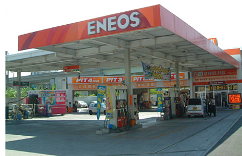
車検工場・ディテール工場併設SS 与那覇店