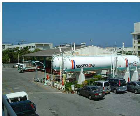
浦添物流センター LPガス充填所

【業務内容】LPガスおよびLNG(液化天然ガス)の販売／容器並びに 燃焼機器等の販売／空調機器(GHP)の販売