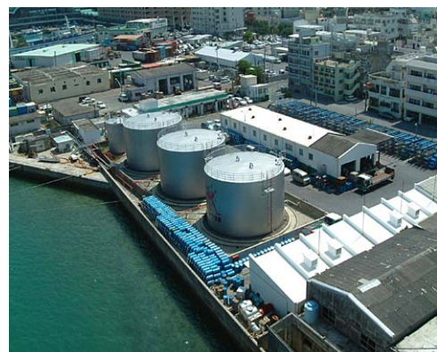
那覇物流センター