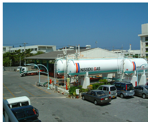
浦添物流センター LPガス充填所

【業務内容】LPガスの販売／容器並びに燃焼機器等の販売／空調機器(GHP)の販売