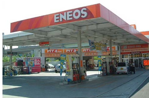
車検工場・ディテリング工場併設SS 与那覇店