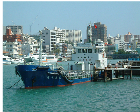
バージ給油船 第八旭丸

【業務内容】石油及び潤滑油の直売/エネルギー商品(分散型電源等)の販売/空調機器(KHP)の販売